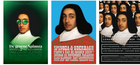
Afiches voor de jaarlijkse Spinozadag, (ASK i.s.m. Paradijs)

Spinoza is de vlaggendrager voor zijn tijd- en stadgenoten, omdat hij zijn leven en filosofische ontwikkeling niet alleen te danken heeft gehad aan de stad, maar vervolgens ook een warm pleitbezorger is geworden voor intellectuele en godsdienstige vrijheid met het zeventiende-eeuwse Amsterdam als lichtend voorbeeld.