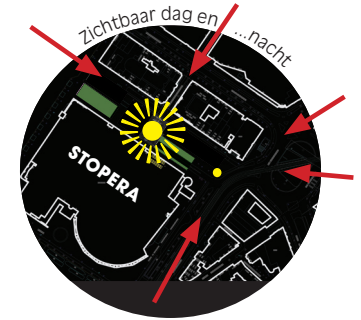
Zie ook www.amsterdam.nl/ het stadshuis verhuurt

Het Spinozacentrum Amsterdam biedt de mogelijkheid om allerhande activiteiten te verrichten die het belang van Amsterdam, als intellectueel centrum in de 17e eeuw, voor een binnen- en buitenlands publiek duidelijk maken. Het is een plek waar inwoners en bezoekers van de stad informatie kunnen krijgen, een tentoonstelling kunnen bezoeken, een wandeling kunnen beginnen of een cursus kunnen volgen.