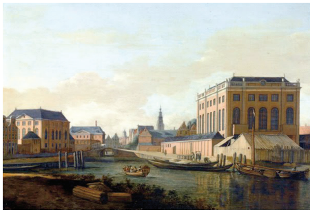
Gerit Adriaensz. Berkheytje Portuges en de Grote Synagoge Amsterdam 1639-98?

1581 Philips II verovert Portugal en de Inquisitie maakt het leven voor bekeerde joden moeizaam. Velen vluchtten. Zo ook Spinoza's grootvader die naar Nantes gaat rond 1605. Voor 1621 De familie van Spinoza's vader Michael komt naar Amsterdam vanuit Nantes.