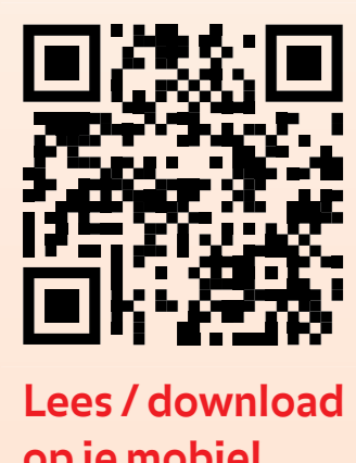
Lees / download op je mobiel

Spinoza... de handtekening van Amsterdam