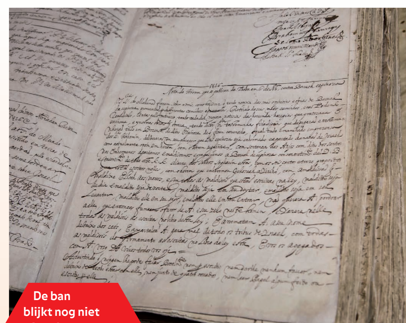
De ban blijkt nog niet verjaard... Eind 2021 werd Spinoza door een orthodoxe rabbijn (Serfaty) van de Portugese Synagoge opnieuw een ketter genoemd.