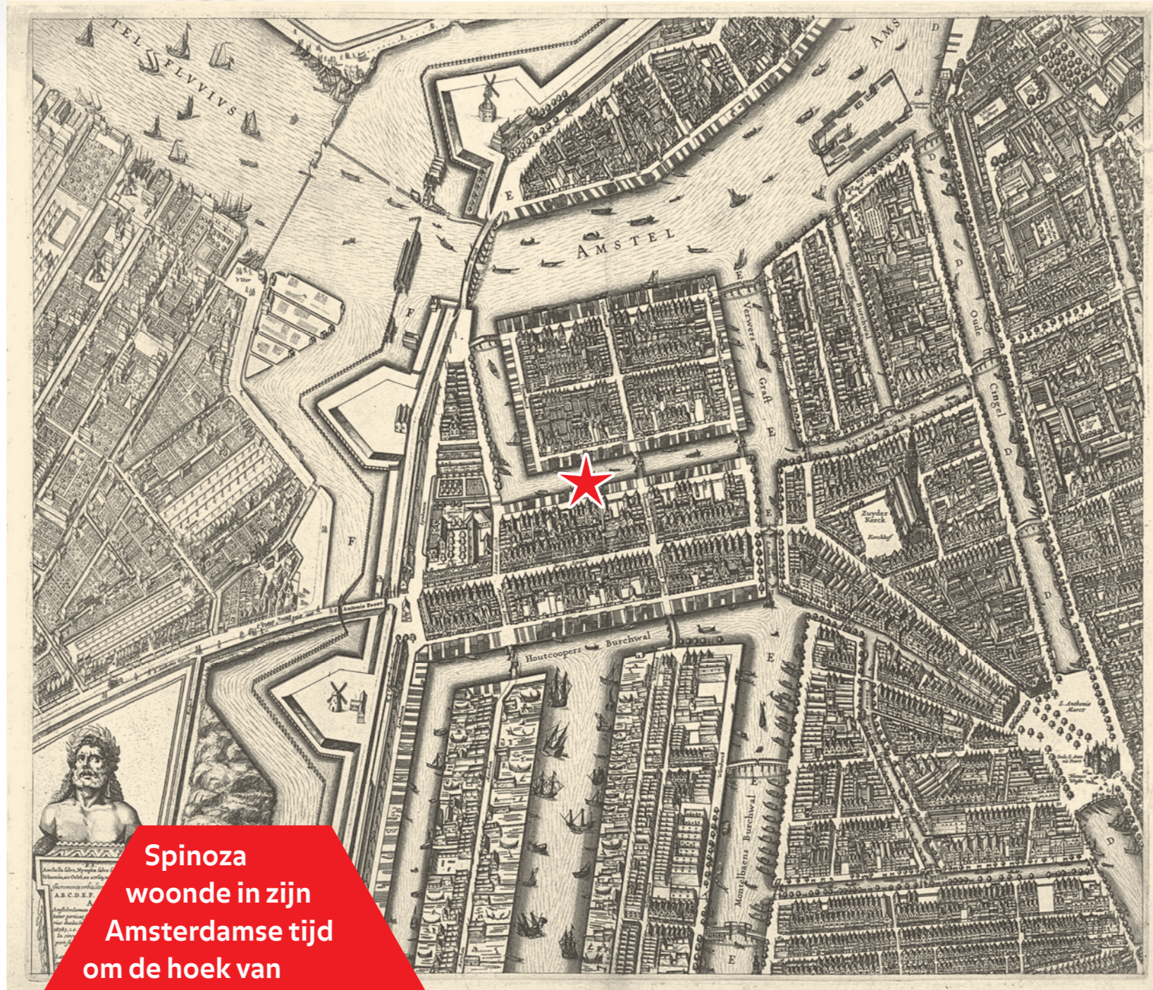
Spinoza woonde in zijn Amsterdamse tijd om de hoek van Rembrandt. Misschien zag hij de jonge Spinoza soms langswandelen.

• TWEDE GENERATIE VLUCHTELING Bento de Spinoza werd in 1632 geboren in Amsterdam op Vlooienburg, een ingepolderd eilandje in de Amstel - nu staat er het stadhuis/muziektheater (de Stopera). Zijn ouders waren vluchtelingen. In 1492 waren joden en moslims uit Spanje en Portugal verdreven in wat tegenwoordig een 'ethnische zuivering' heet. Alleen zij die zich gedwongen tot het christendom bekeerden, mochten blijven. De joden die dat deden werden nieuwe christenen of 'marranen' genoemd (een scheldwoord dat zwijnen betekent) omdat de samenleving hen niet accepteerde. De Spaanse inquisitie (een soort kerkelijke politie) bleef hen vervolgen.