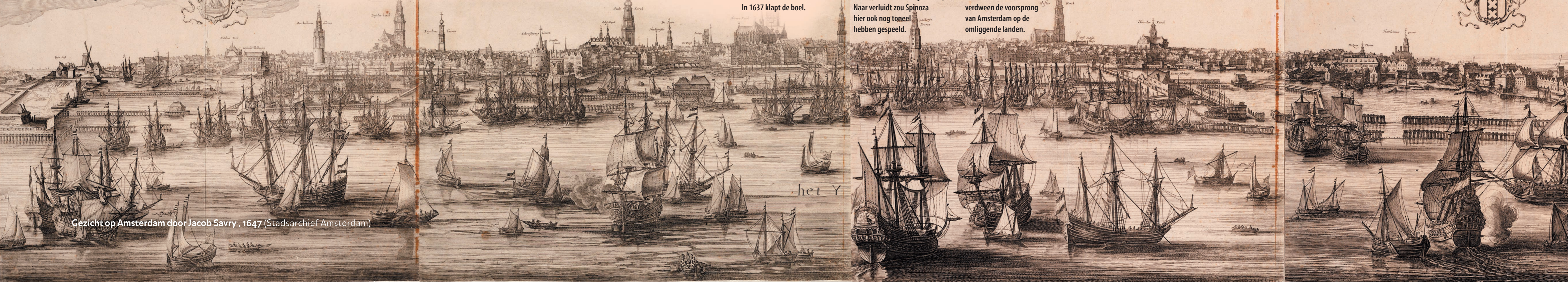
Gezicht op Amsterdam door Jacob Savry, 1647

Spinoza... de handtekening van Amsterdam