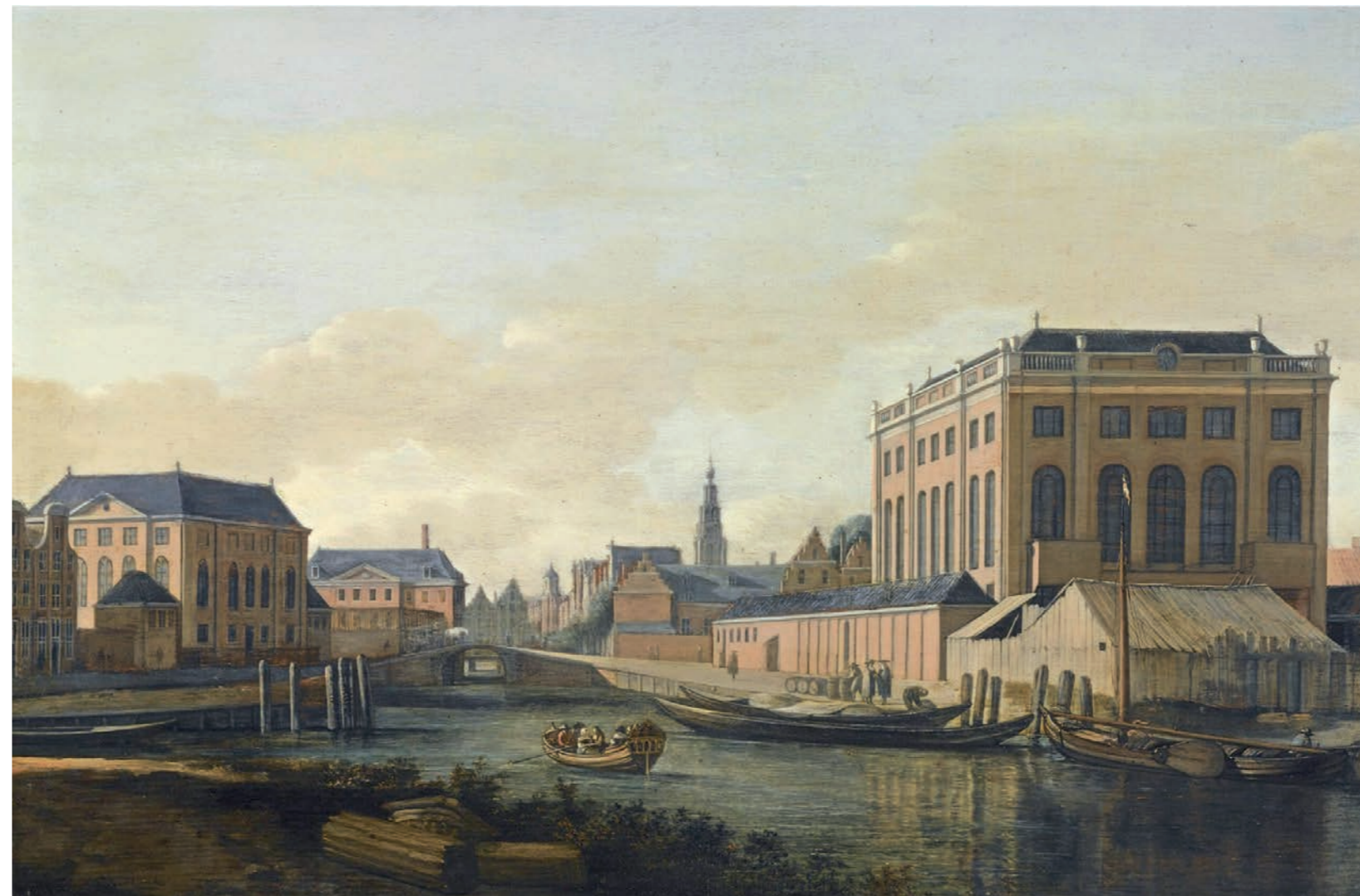
Zicht op de Portugese synagoge (geschilderd door Berckheyde rond 1679).

1798 Burgerrechten voor alle inwoners van Nederland.